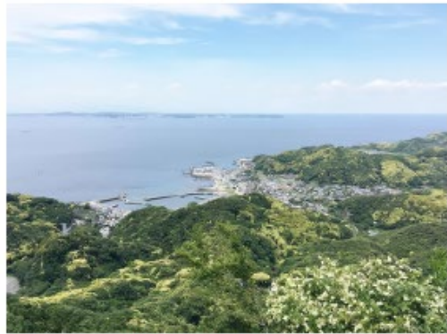
十州一覽台から東京湾