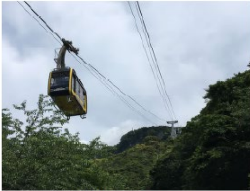
鋸山ロープウェイ