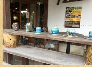
2日目 ④益子陶芸美術館