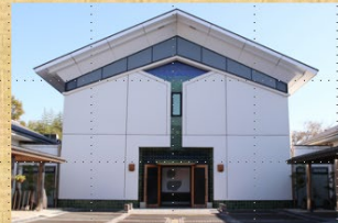
2日目 ⑤濱田庄司記念益子参考館