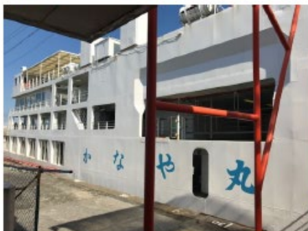
東京湾フェリーと船内の様子