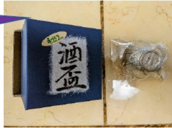
錫のぐい呑み (出来上がり品)