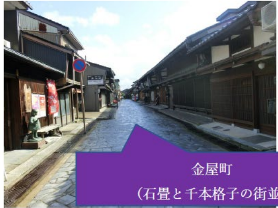
金屋町 (石畳と千本格子の街並)