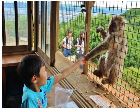
あらしやま岩田山モンキーパーク