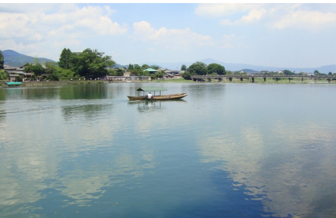
船着き場近辺と渡月橋 https://www.photo53.com/