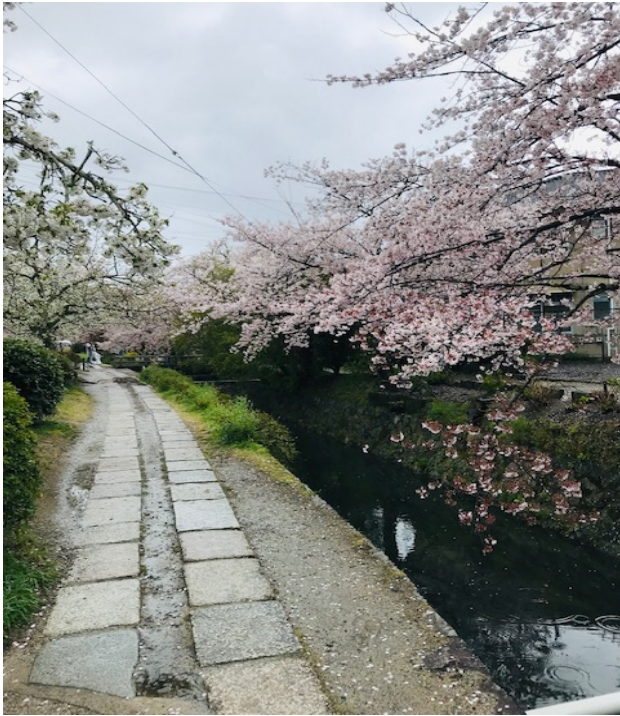
哲学の道