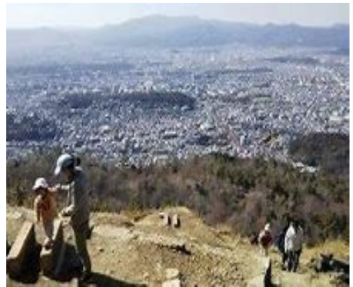
大文字山から京都盆地を望む