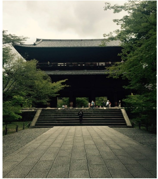
南禅寺三門