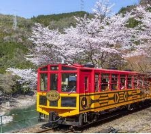
嵯峨野トロッコ列車 https://www.sagano-kanko.co.jp/