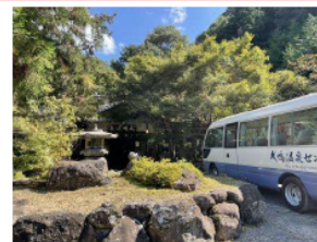
鳴滝温泉 センター